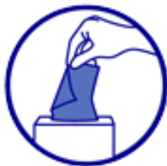
Mouchoirs à usage unique