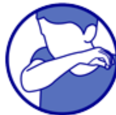
Tousser et Éternuer