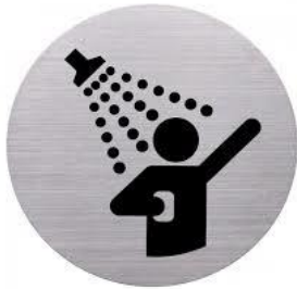
Douche quotidienne Après l'accueil