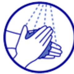
Lavages à l'eau et au savon fréquents Et après tout contact direct avec un enfant