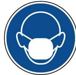
Port du Masque